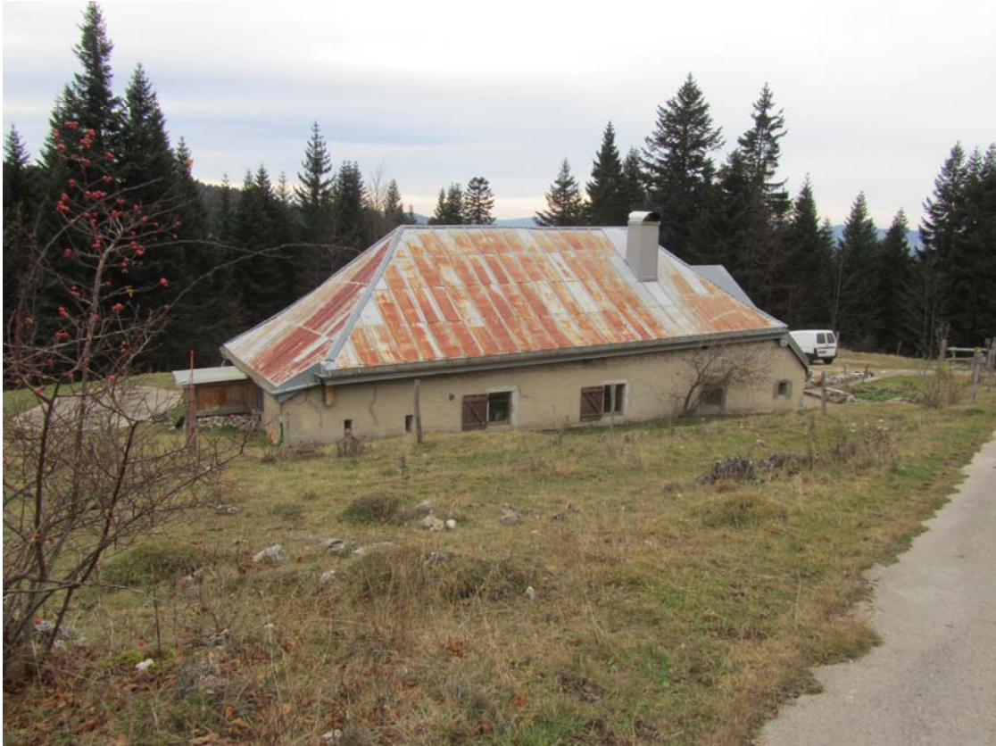
Vue d'en haut, la bâtisse présente encore une forme tout à fait typique des chalets d'alpages. Plan rectangulaire, toit à deux pans brisés.