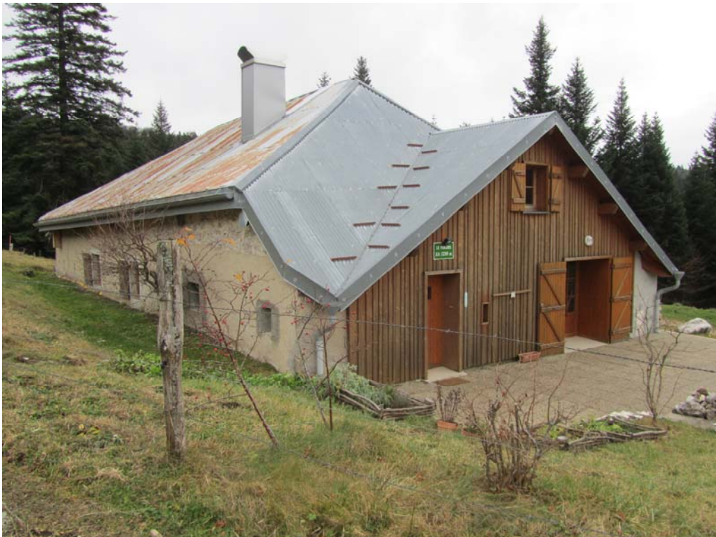
Prolongation un peu curieuse du pignon nord-ouest.