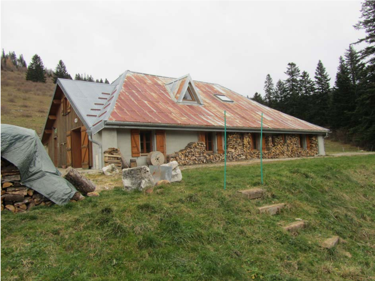
Nul doute que ce ne soit plus un chalet d'alpage. Les espaces autrefois pâturables, trop en pente, se reboiseront peu à peu.