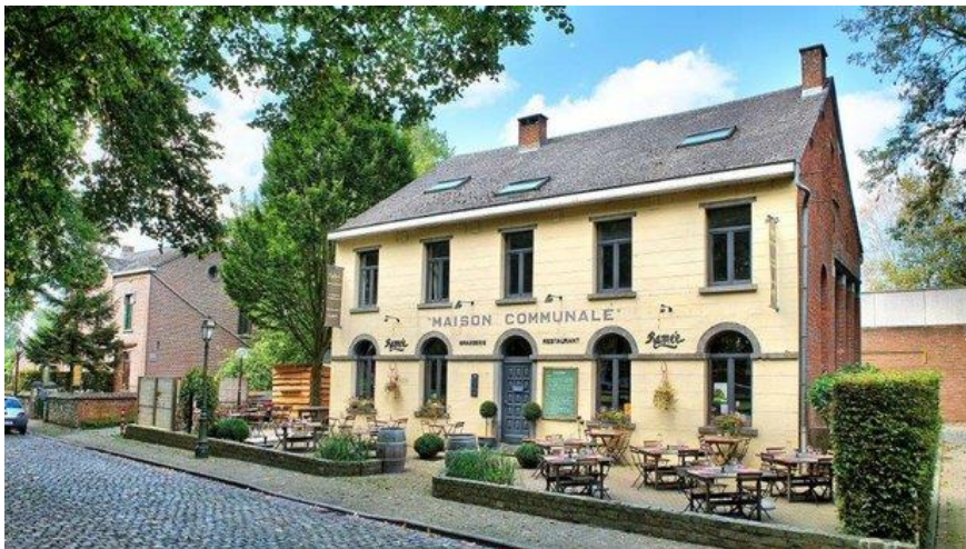
Un joli bâtiment devant lequel peut passer de temps à autre notre ami Roger.