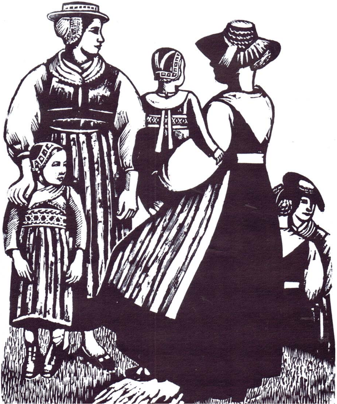
Les paysannes, 1930.