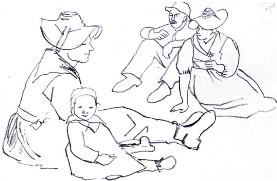
Dimanche en Valais, 1930.