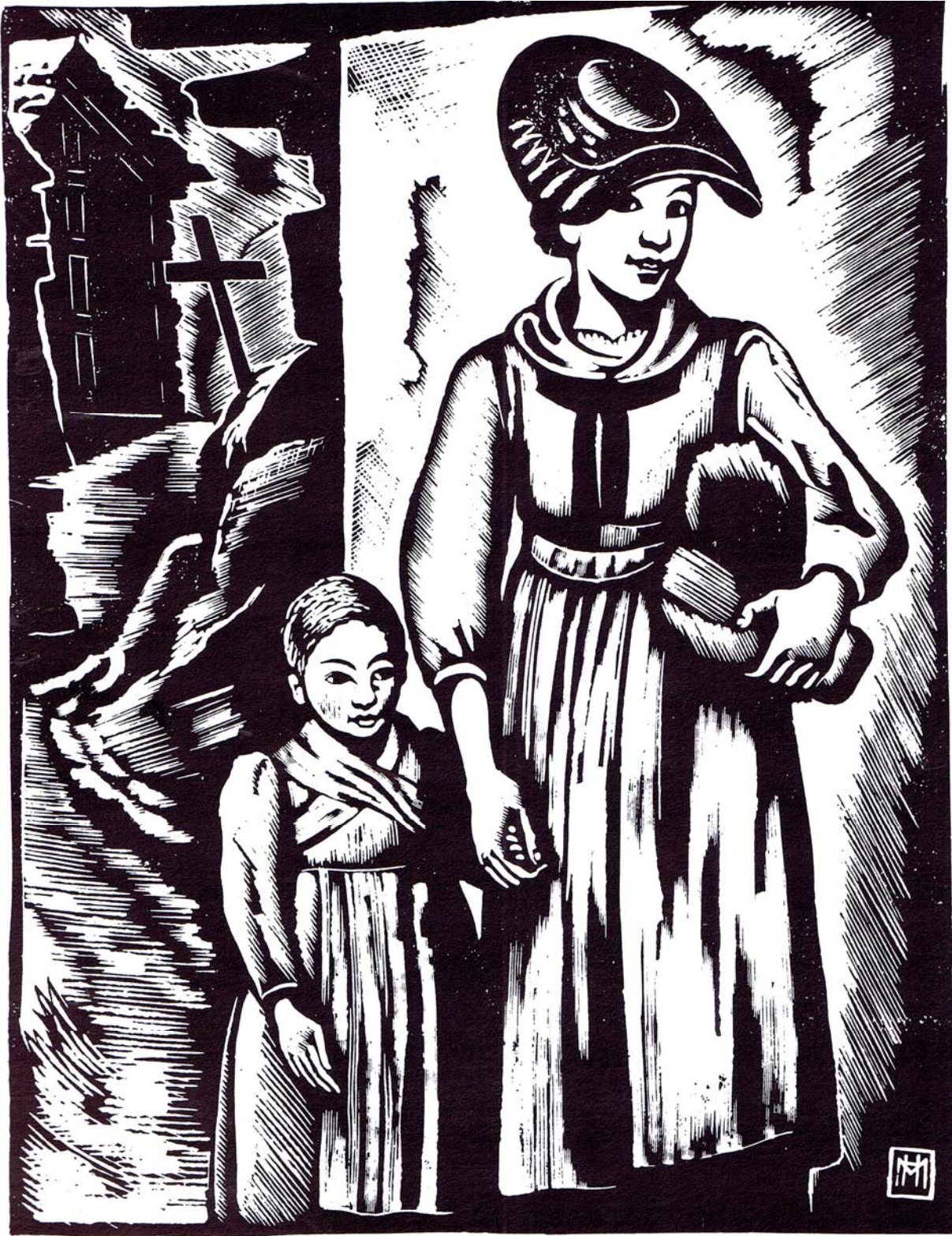
Femme et enfant, 1930.