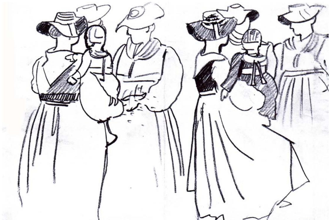
Valisannes un jour de fête, 1930.